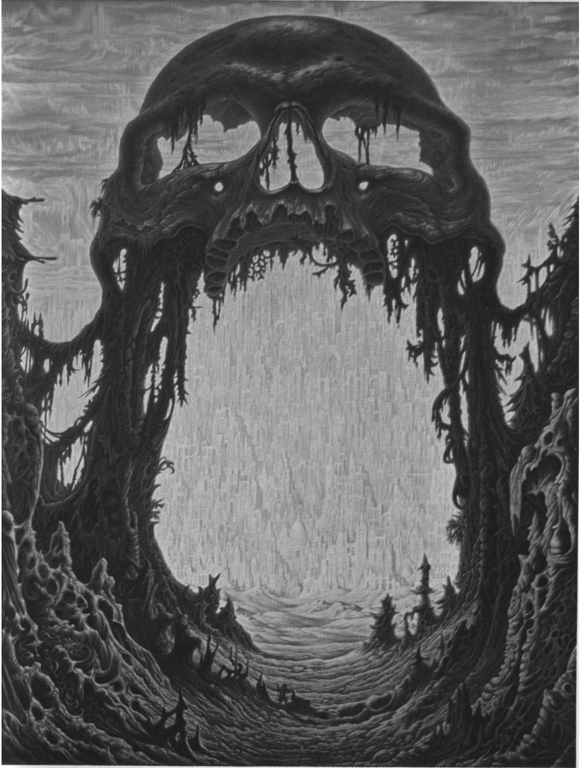
La Porte de Saturne